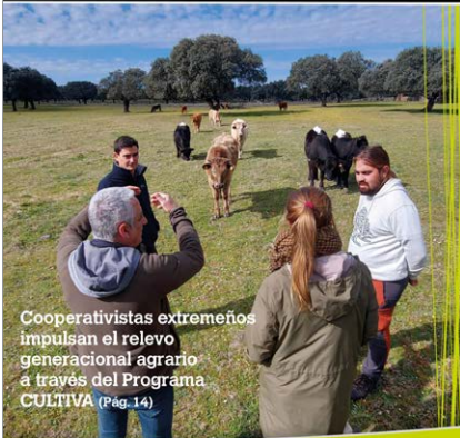
Cooperativistas extremeños impulsan el relevo generacional agrario a través del Programa CULTIVA (Pág. 14)